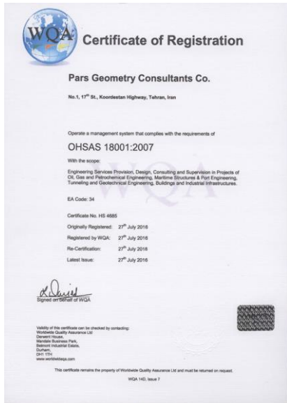
گواهینامه استاندارد OHSAS 18001:2007