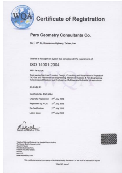
گواهینامه استاندارد ایزو ۱۴۰۰۱