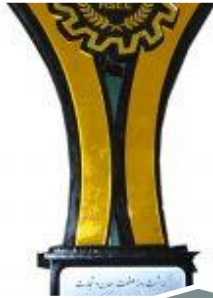
دومین کارگاه ملی و مهندسی ارزش در صنعت ساختمان