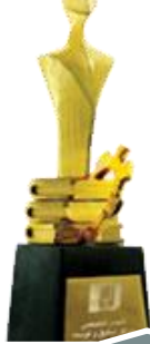
جایزه ملی بهره وری و تعالی سازمانی ۱۳۹۰